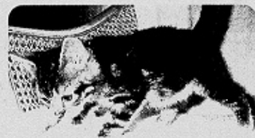
Hansdampf in allen Gassen

Auf dem Boden im Wohnzimmer tummeln sich drei Katzenbabys. Zwei davon sind richtig frech und machen sich gleich über die Schnallen an meinen Schuhen sowie die Bänder meiner Kameratasche her. Der kleine schwarze Kater bleibt etwas schüchtern im Hintergrund und beobachtet das alles erst einmal. Rosemarie Kratzer nimmt die kleine Schwarze mit dem weißen Kinn hoch und sagt: „Immer wenn eine Katze ein neues Zuhause findet, frage ich mich: