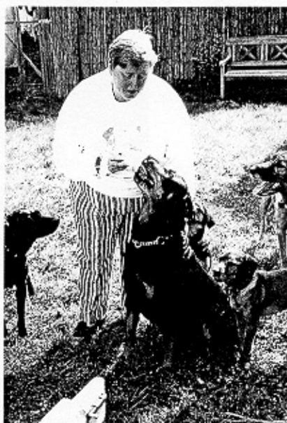
Außen ein normales Reihenhaus – innen ein liebevolles Heim für herrenlose Tiere. Links: Rottweiler Aiko hängt an der Flasche

Katzen sind auch einst abgegeben worden, aber von ihnen hat sie sich nicht trennen können. Und: „Wer einmal den Namen Brand trägt, wird nie mehr hergegeben!“