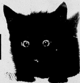
Kleiner stolzer Kater

Diese supersüße Katze ist inzwischen etwa drei Monate alt, ausgesprochen aktiv und abenteuerlustig. Alles Neue muss sofort von ihr erkundet werden. Schmusen und Spielen stehen auf der Liste ihrer Lieblingsbeschäftigungen ganz weit oben.